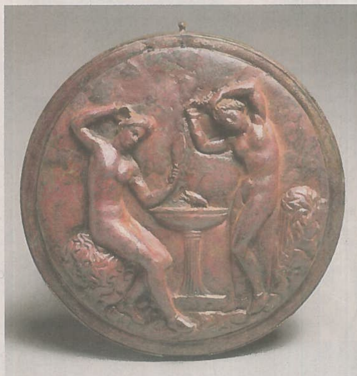
Spiegeldose mit Frauen, 4. Jh. v. Chr.

ältesten Exemplare sind Grabbeigaben aus Obsidian, die in neolithischen Gräbern in Anatolien gefunden wurden.